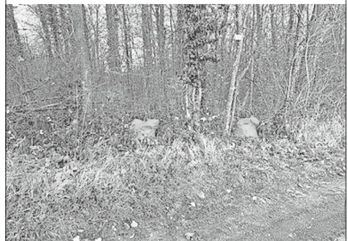
Illegale Müllentsorgung am Eingang zum Saatschulweg vom 27.01.2023