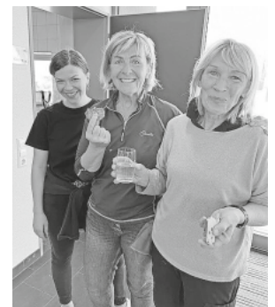
Zum Abschluß wurde gevespert

Die Putzaktion war nicht nur ein großer Erfolg in puncto Sauberkeit, sondern auch für die Gemeinschaft. Insgesamt war die Putzaktion eine gelungene Veranstaltung, die gezeigt hat, dass sich gemeinsames Engagement und Zusammenarbeit lohnen. Zum Abschluß wurde in der Halle gemeinsam gevespert. Wir freuen uns schon auf die nächste „Hallenputzede“ mit tatkräftiger Hilfe der Auggener Vereine.