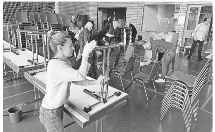
Die Tische sahen hinterher wie neu aus

Die Helfer der Vereine waren mit großem Eifer und viel Spaß bei der Sache und hatten sichtlich Freude daran, das Putztuch zu schwingen. Auch das Ergebnis konnte sich sehen lassen: Tische und Stühle sind nun wieder in einem tadellosen Zustand.