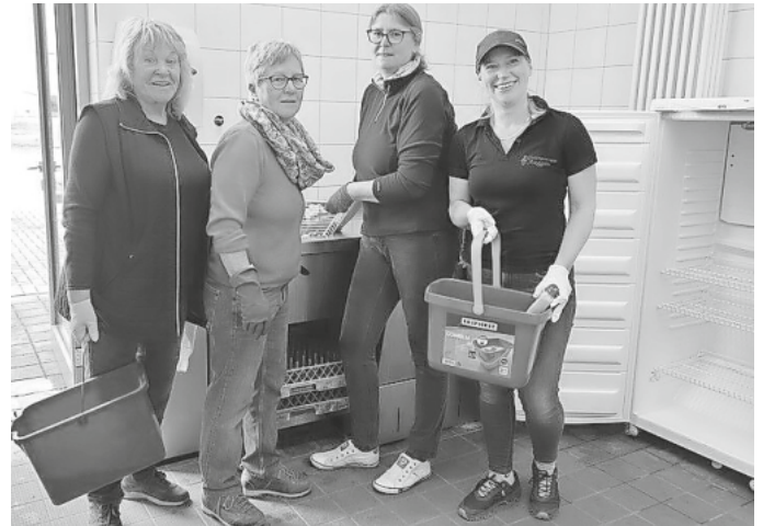
Alle waren fleißig bei der Arbeit

Die Vereine und Vertreter der Gemeindeverwaltung der Gemeinde Auggen trafen sich dann auch am 15.04, um die Putzaktion in der Sonnberghalle durchzuführen. Die Aktion war ein großer Erfolg. Fast 50 Freiwillige beteiligten sich und arbeiteten zusammen, um die ca 100 Tische, 500 Stühle und 5 Kühlschränke gründlich zu reinigen. Es wurde gewischt, geschrubbt und geputzt, bis alles in neuem Glanz erstrahlte.