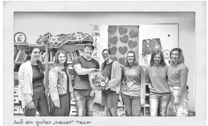
Auf ein gutes „neues“ Team

Team Förderverein Brunwart-von-Augheim-Grundschule