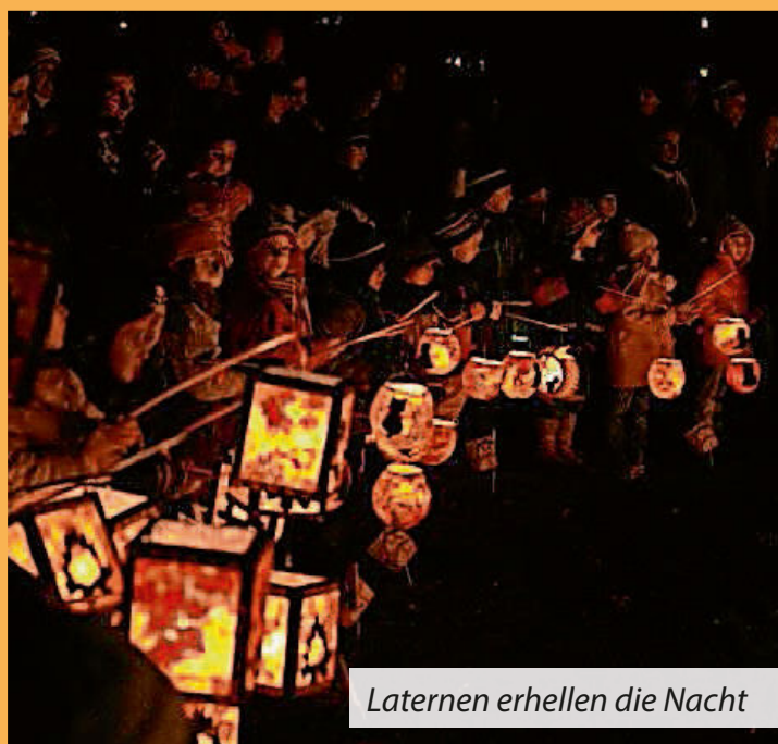
Laternen erhellen die Nacht

Auf Euer kommen freut sich der Kirchengemeinderat.