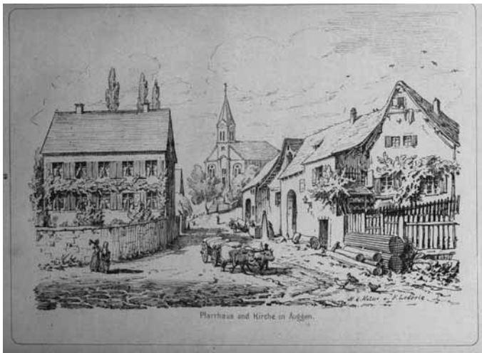
Das „Schillinger-Anwesen um 1876“.