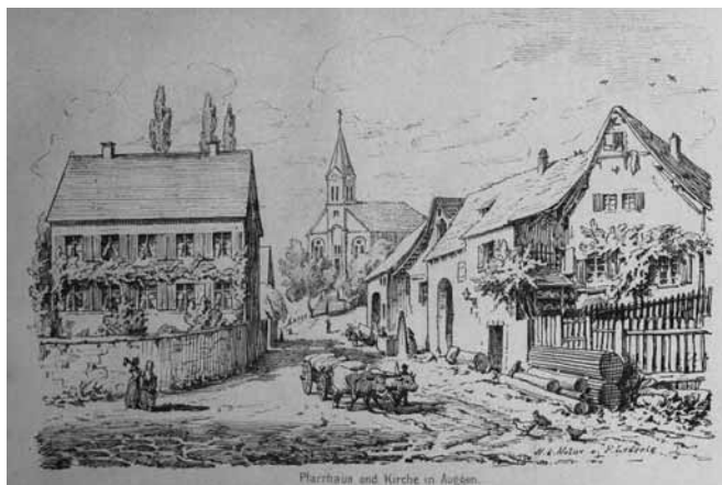
Das „Schillinger-Anwesen um 1876“