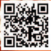
Programm & Tickets

Open Air | Programm & Tickets www.open-air-kino.reservix.de